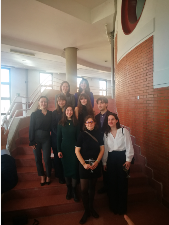
Summer School 2025

FORMATIONS : DROIT • SCIENCES POLITIQUES ÉCONOMIE • GESTION • INFORMATION - COMMUNICATION